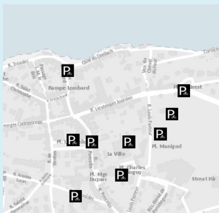
Champ / Légende